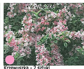
Krzewuska - 2 sztuki