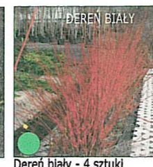
Deren biały - 4 sztuki