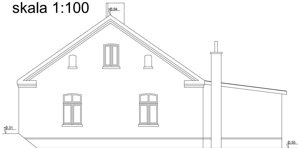
INWENTARYZACJA/ELEWACJA WSCHODNIA skala 1:100