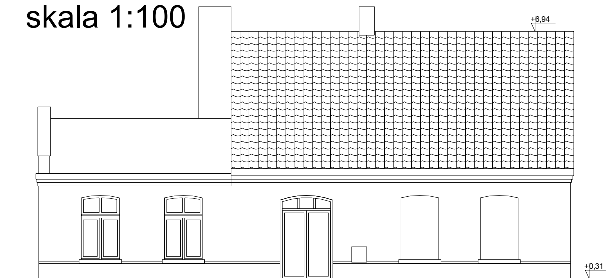
INWENTARYZACJA/ELEWACJA PÓŁNOCNA skala 1:100