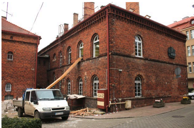
MBP w trakcie remontu

Mediateka to zupełnie nowa jakość i nowa przestrzeń na kulturalnej mapie Tczewa. To miejsce w którym każdy, bez względu na wiek, znajdzie coś dla siebie, począwszy od tradycyjnych zbiorów bibliotecznych, poprzez ciekawą ofertę edukacyjną, aż po dostęp do nowoczesnych narzędzi i technologii, służących do swobodnego „poruszania się” w świecie literatury, gier i muzyki. Panujące tu warunki idealne nadają się do kreatywnego spędzania wolnego czasu. W koń-