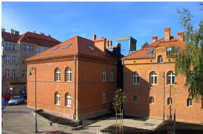
MBP po remoncie