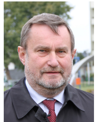
Mirosław Pobłocki Prezydent Tczewa

Warto przy tym podkreślić, że wykorzystanie autobusów było w miarę równomierne, gdyż wdrożony nowy rozkład jazdy – z rytmicznie wykonywanymi kursami w stałych taktach i dobrą koordynacją rozkładów jazdy różnych linii na wspólnych odcinkach tras – spowodował rozłożenie pasażerów pomiędzy sąsiednie kursy.